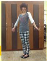
アシスタント エゾ

服を買う時は大きめより小さめを買うようにしています。理由は太ると気づきやすいからです(笑)