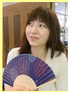
レセプション しゅどう

●夏は、最低限の照明だけで夜ご飯を作っています。リビングを点けると虫が寄ってくるので、必要な時は消しています。遮光カーテンにしなかったのは失敗ですが、節電になっています。