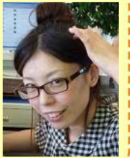
レセプション チャド

●少々遠くても車を使わず、自転車や歩きで出掛けることです。車のスピードでは気づけないことが気づけたり、いい運動にもなりとても楽しいです。ただ、かなり日に焼けますが・・・