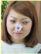
アシスタント エリ

●CMでもよく見ますが、「～しっぱなし」というのを気をつけてます。テレビのつけっぱなしや水の流しっぱなしなど、つついちゃってしまいがちな事をしないように心がけています。