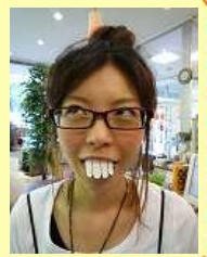
レセプション チャド

それは…おもしろ写真をとることで。休みの日はカメラを必ずもってでかけます。あとで見て楽しい気分になれるのでおすすめですよ