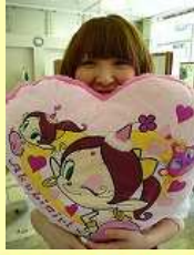
アシスタント エリ

アニメのハクション大魔王に出てくるアキビちゃんのクッションです。♥型でとても可愛い物ですが、私は毎日これを頭でつぶして寝ています。これがないと、もう寝れません・・・(笑)