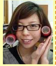
レセプション チャド

今は特にありません💧でも、1つのものを大切に長く使うということはエコにもつながって地球にやさしいと思うので、これからは長く愛せるものを探して見つけていこうと思います!!